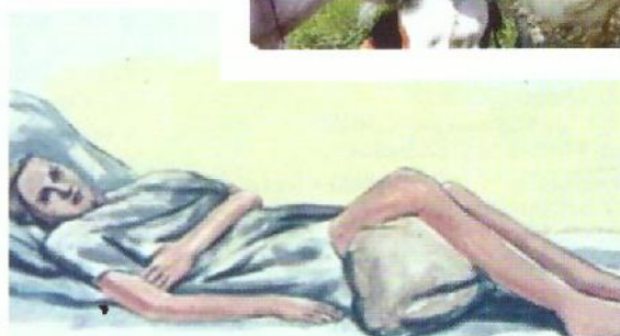
Поражение нервно-двигательного аппарата