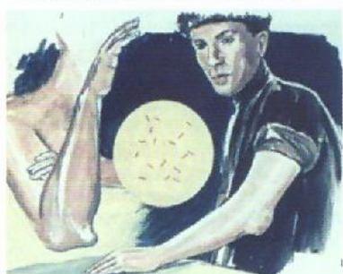
Обострение бруцеллеза (артрит)